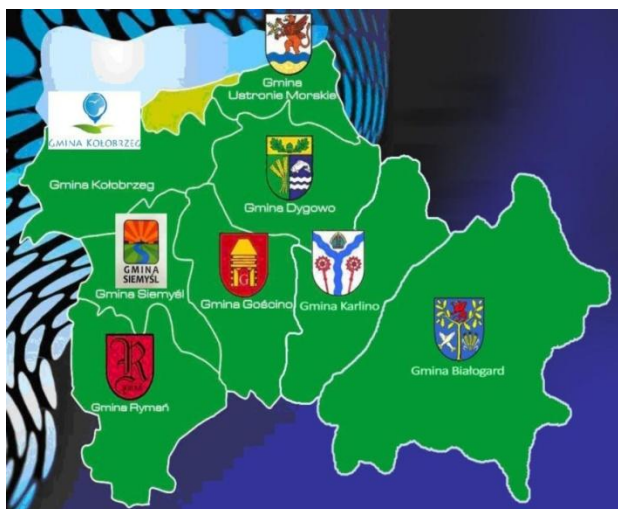
Mapa 1. Mapa obszaru

Spójność przestrzenna obszaru objętego LSR jest zachowana, gdyż gminy będące członkami LGD graniczą ze sobą i są położone w bezpośrednim sąsiedztwie. Cały obszar jest spójny w kontekście geograficznym.